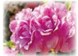
⑥センエオオムラサキ