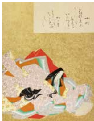
小野小町 花の色盤うつり爾希利那い多つらにわ可身よ爾ふるな可免せ之万爾