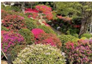
昨年4月4日 散った花がなく花と新緑のコントラストが美しい頃

※年によって開花時期は異なりますので、詳細は根津神社 HP・Instagramで確認ください