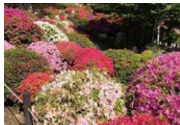
昨年4月19日 遅咲きのお花を中心にゆっくりと例年より早めに咲いたため傷んだお花も