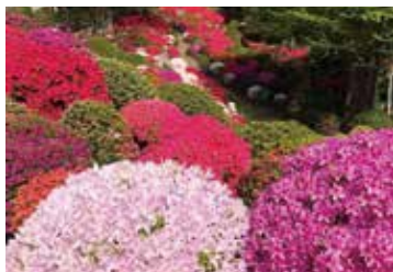
昨年4月12日 一番多くのお花が咲いたタイミング