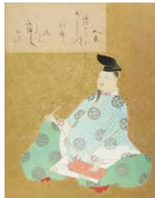
柿本人麻呂 ほの々々とあ可し能うら乃朝霧爾嶋可久連ゆ九舟越しそおもふ