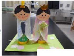
こうさく 工作 (ひな人形)