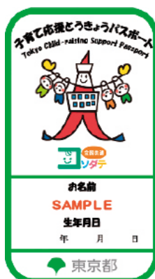
デジタルパスポート