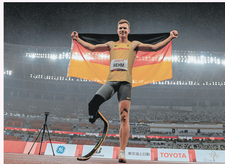
走り幅跳びで金メダル3連覇を獲得したマルクス・レーム選手