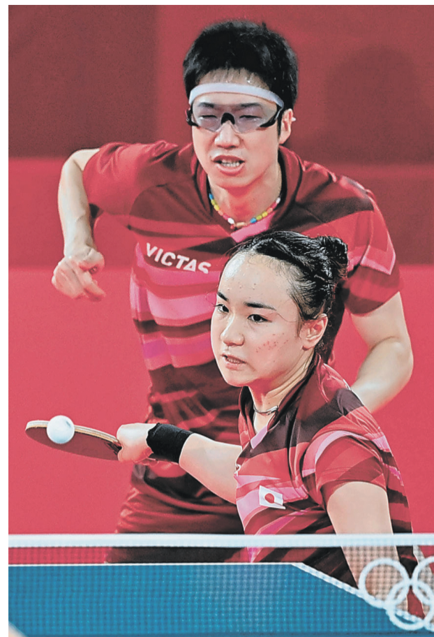
卓球混合ダブルスで中国ペアとの決勝を制した伊藤美誠選手(手前)と水谷隼選手