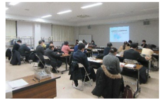
検討会当日の様子