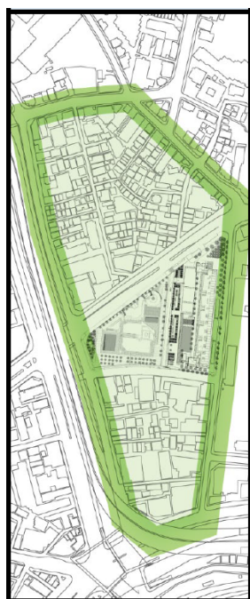
整備指針の改定 (令和3年8月)