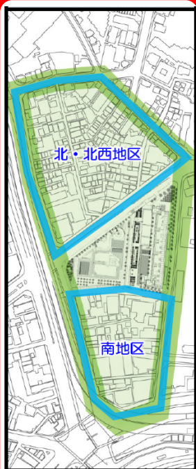
北・北西地区： しゃれ街の検討