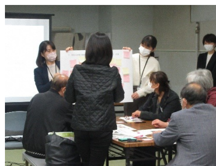
<検討会当日の様子>