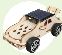
【木製ソーラーカー 組立キット】

デザイン等は変更になる可能性があります。また在庫数によって選べないこともあります。