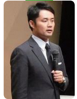
講師 杉村太蔵氏 (元衆議院議員)

平成30年12月15日、文京シビックホール 小ホールにおいて「白ばらセミナー」が望む未来へ」を開催しました。第一部は、元衆議院議員の杉村太蔵氏を講師に迎え、「一緒に考えよう、日本の将来」と題した基調講演を行いました。内容は、日本の将来について、その歴史や現在の年金制度等も題材にし、来場した若い方をも巻き込んで一緒に考えていくというものでした。来場者からも大変好評で、あっという間の75分でした。