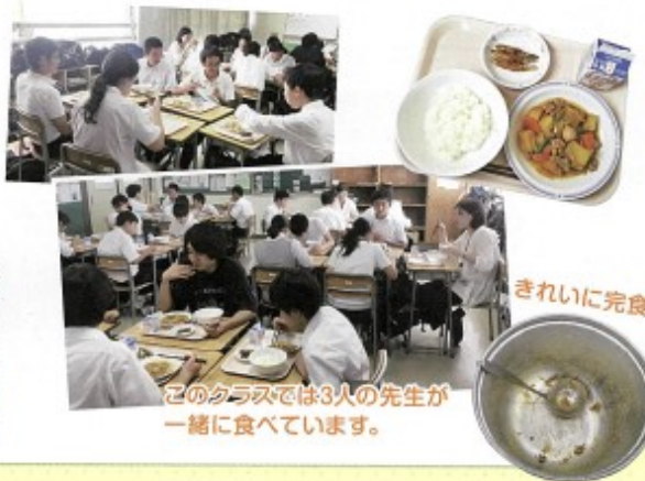
このクラスでは3人の先生と一緒に食べています。