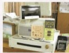
ステッカーや啓発ポップを掲示