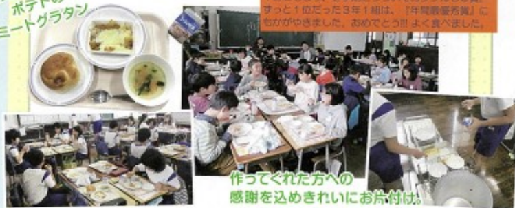
作ってくれた方への感謝を込めきれいに片付け