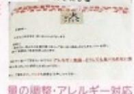
量の調整・アレルギー対応