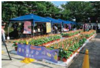
文京朝顔・ほおずき市 (7月23日(土)・24日(日))