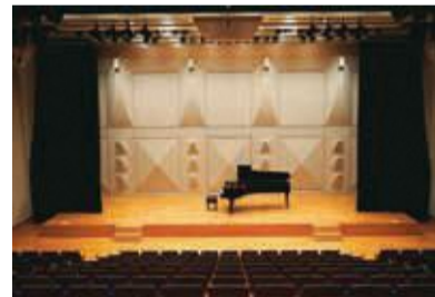
文京シビックホール小ホールリニューアル(10月2日(日))