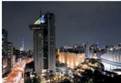
ウクライナ国旗色にライトアップ (3月7日(月)～6月17日(金))