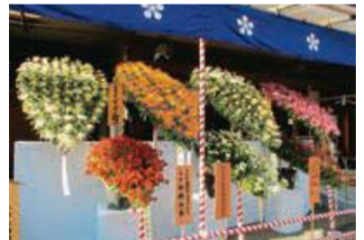
文京菊まつり (11月1日(火)～22日(火))