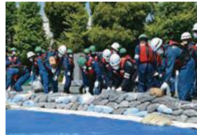
文京区合同総合水防訓練 (5月19日(休))