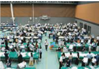
参議院議員選挙開票のようす (7月10日(日))