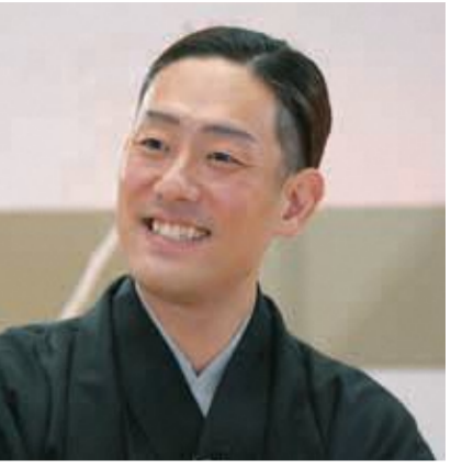
中村勘九郎 (なかもらかんくろう) 昭和56年(1981)文京区生まれ。昭和61年(1986)歌舞伎座『盛綱陣屋』の小三郎で初お目見得。昭和62年(1987)歌舞伎座『門出を名乗り初舞台。平成24年(2012)新橋演舞場『春興鏡獅子』の小姓弥生後に獅子の精ほかで六代目中村勘九郎を襲名。

七之助 懐かしい。やはり子どもの頃の記憶が強いんです。真の児童館で遊んだり、文房具屋さんで近くであって、こいでカードとか、ガチャガチャをやったりした思い出があります。