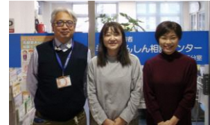
見守り窓口相談員