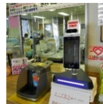
サーマルカメラ (体温測定)