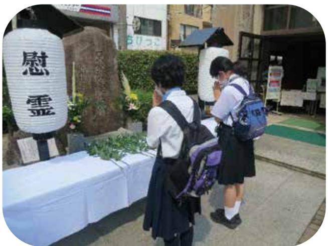
⑨献花を行う平和特派員