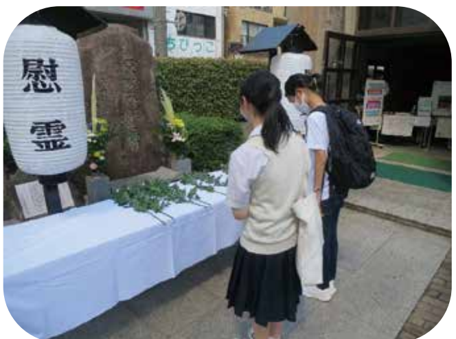
⑧献花を行う平和特派員