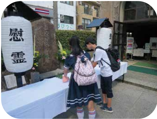
⑤原爆慰霊碑に献花を行いました。