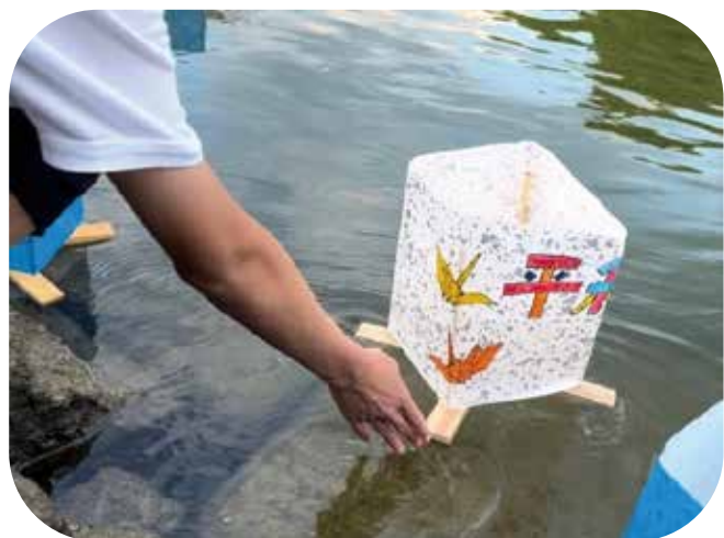
③元安川へ作成した灯籠を流します。