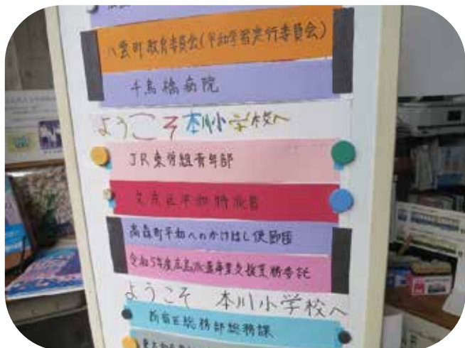
③本川小学校在校生による歓迎看板