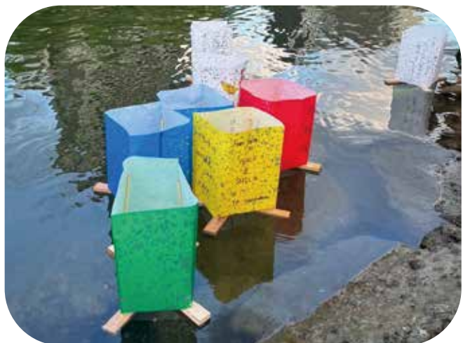
⑤元安川を流れる灯籠