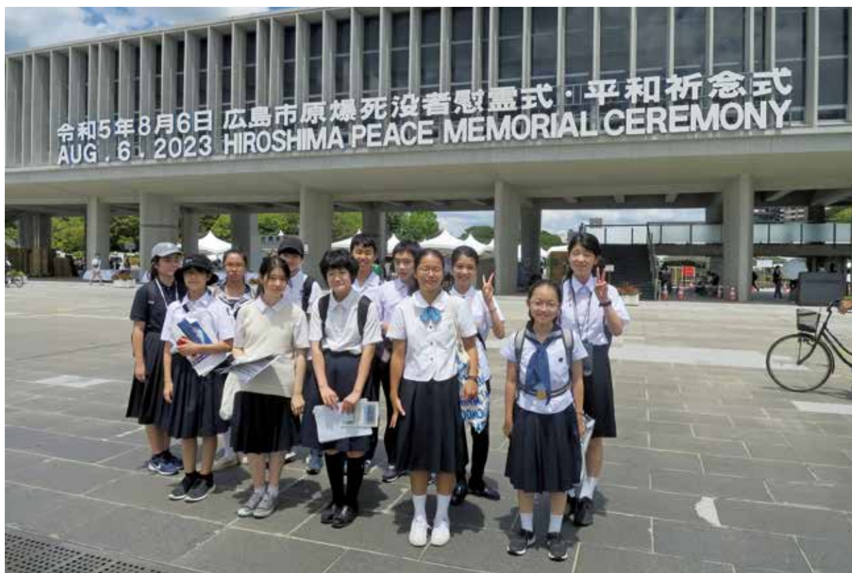
平和記念式典会場入口