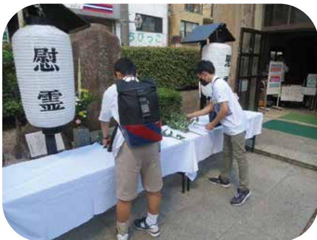
⑦献花を行う平和特派員