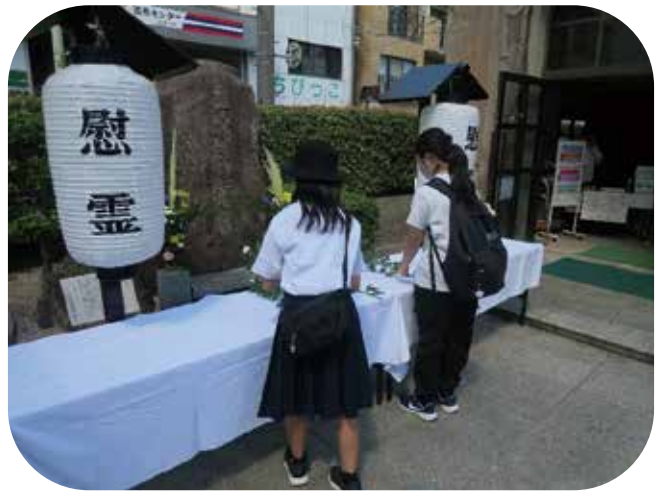
⑥献花を行う平和特派員