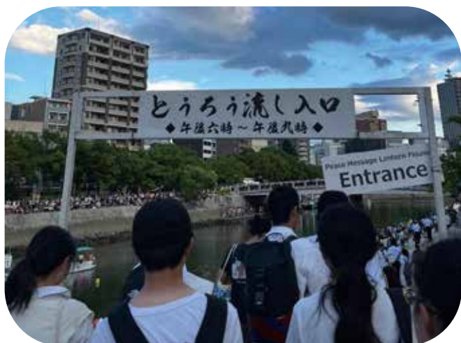
①元安川の灯籠流し会場へ