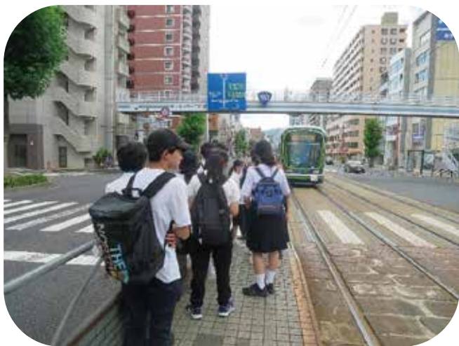
①路面電車で本川小学校平和資料館へ