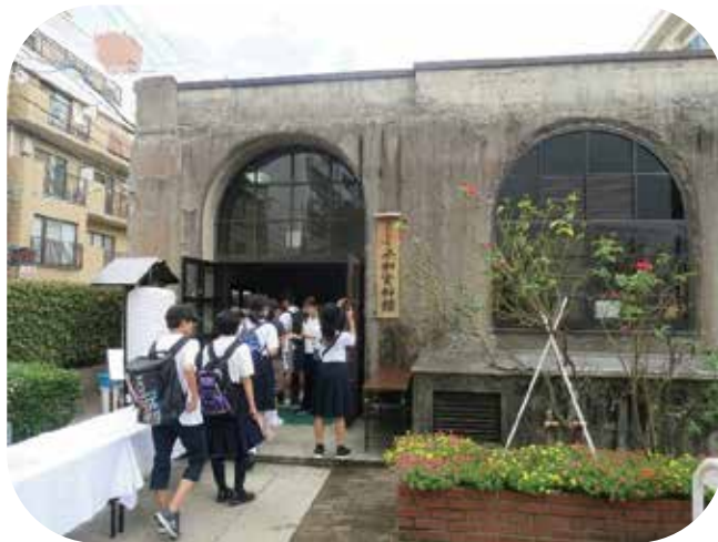
②資料館は、広島市立本川小学校に隣接した場所に あります。