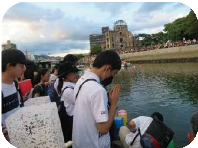
④それぞれが想いを込め、灯籠を流しました。