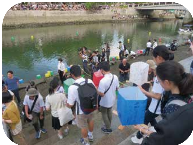
②会場は、原爆ドーム対岸にある親水護岸です。