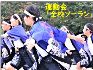
運動会 「全校ソーラン」