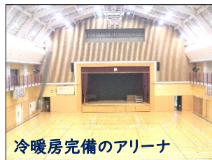
冷暖房完備のアリーナ