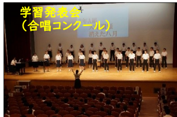
学習発表会 (合唱コンクール)