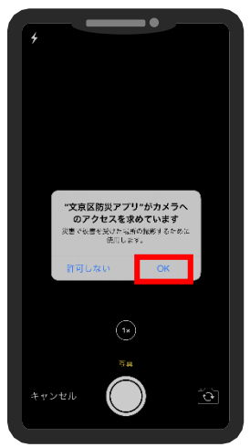
OKをタップして撮影