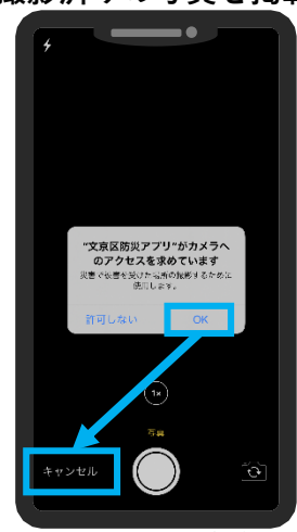
OK→キャンセルをタップ