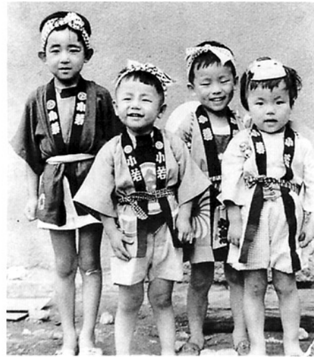
白山神社祭礼の子どもたち 昭和32年（1957）

ある特定の時期に行われるさまざまな行事を総称して＜儀礼＞といいます。＜儀礼＞は大きくふたつに分類することができ、人がこの世に生まれてから死ぬまでの一生を人生儀礼、家毎に行われる一年間の行事を年中行事といいます。人生儀礼には大きく分けて産育・婚姻・葬送があります。産育とは出産と育児のことで、安産祈願・出産の場所・産婆・宮参り・七五三などがこれにあたります。婚姻では、結納や結婚式の形態の変化などが中心となります。葬送は、葬式・墓地・年忌供養などのことをいいます。年中行事は正月・春秋彼岸・盆など一般的な行事のことを指