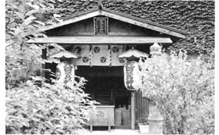
和紙の神様を祀る天日鷲神社