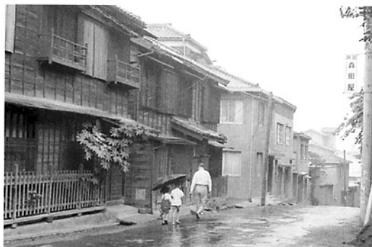
無縁坂 昭和39年

『ぶんきょうの坂道』戸畑忠政編著、文京区教育委員会、2001年 『樋口一葉日記（翻刻）』鈴木淳・樋口智子編、2002年、岩波書店