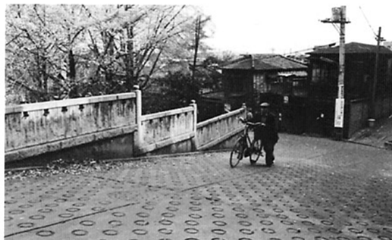
新坂（根津権現坂・S坂）昭和36年