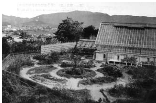
図7「東海名勝蒲郡常磐館風景 丘上温室ノ一部」(個人蔵)

…蒲郡の海!それは、瀬戸内海のやうに静かだ。低い山脈に囲まれ、その一角が僅に断れて、伊勢湾に続いて居る。風が立つても、白い波頭が騒ぐ丈で、岸を打つ怒濤は寄せては来ない。…この海岸の風光を独占するやうに、旅館常磐館が建つてゐる。…その丘陵には、梅林があり花園があり、小さいながら動物園がある。大弓あり楽焼の窯場がある。庭園には、姿の美しい小