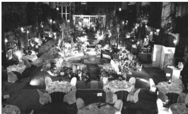
図5 奇跡の星の植物館 淡路夢舞台ラン展 2009

見たこともないアメリカや東南アジア産の洋蘭を並べた温室に貴顕紳士淑女を招き、接待空間として大いに活用しました。図5に示したのは、兵庫県立淡路夢舞台温室「奇跡の星の植物館」で本年(2009)2月に行われたディナーショーの風景です。食事の後は、オペラや温室の歴史の話に耳を傾け、100年前に大隈が主宰した晩餐会をイメージし、現代の日本にはなくなってしまった社交空間としての温室を演出しました。