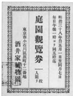
図6「酒井家植物園 庭園観覧券」 (01-0294)

意識していた証拠であり、同時代に華族や経済人の多くが温室を所有していたのも、西洋式的生活スタイルを真似たと考えられます。