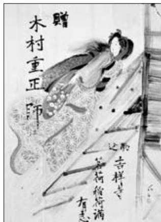
浪曲師テーブルかけ 館蔵 (部分、2枚のうち1枚)

伊藤晴雨(1882-1961)は、明治42年(1909)頃から昭和36年(1951)の没年まで、駒込動坂町(現、千駄木5)に約50年住みました。縛り絵など際どい画風が有名ですが、文京の風景を描いた作品ものこしています(表紙