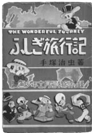
『漫画少年』附録・手塚治虫『ふしぎ旅行記』（当館蔵）