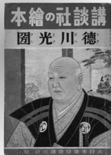
『講談社の絵本』(当館蔵)