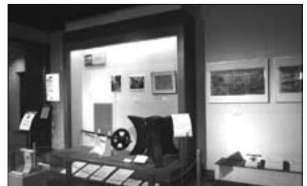
ミニ企画 見え隠れする纏