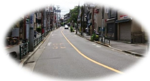
三崎坂、首振り坂など (色々な名前がついています)