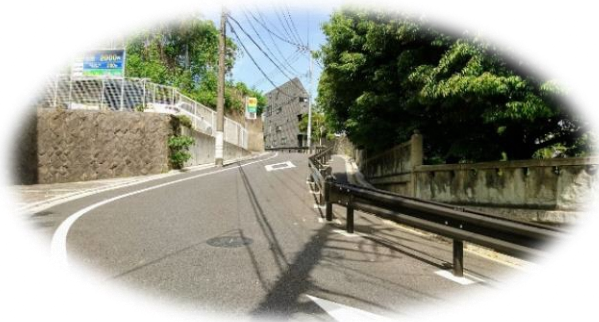
新坂、権現坂、S坂など (色々な名前がついています)

個性豊かで魅力的な谷根千の風景を引き立てているのは、数多くの坂道かも知れません。