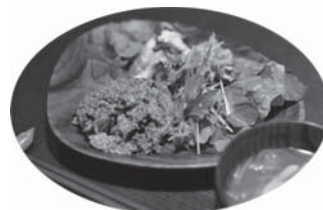
「日替わりワaffleプレート」 千葉県鴨川自然王国の自然野菜をメインに使用したおかずと酵素玄米の看板メニューです。