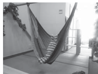
当店のシンボル、プレイスペースとハンモックです。量が素足にやさしいプレイスペースで、子どもたちはのびのびと遊んでいます。