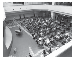
「シビックコンサート」

短期大学では、社会人の受け入れの一環として、特に50歳以上の方々を対象とした、特別な授業料と長期履修制度を設定して、アカデミックな音楽教育が学びやすい教育環境を整えています。“音楽を学びたいと思った時こそが、本当のスタートです。”