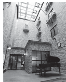
「東邦音楽大学 文京キャンパス ロビー」

文京キャンパスでは、記念館ホールにて学生並びに教員による「サタデーコンサート」(年8回)を開催し、土曜の午後のひとときを地域の皆さまに音楽を楽しんでいただく機会を設けています。このように、本学では音楽を通じて地域の皆さまとの連携を深めています。本学と文京区は平成20年に相互協力に関する協定を締結し、より一層文京区の音楽芸術の発展と文化の振興に寄与すべく環境を整備しています。