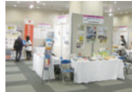
情報発信・学習・知るゾーン

11月22日(金) 11月23日(土)の2日間、区内の産業が集結する文京博覧会(通称:ぶんぱく)を開催します。メイン会場は文京シビックセンター1階と地下2階です。区内の産業・商業・伝統工芸等に触れながら、新しい文京区の魅力を再発見することができるチャンスです。文京区の産業をまるごと体験してください。お待ちしております!