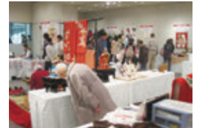
技(わざ)・技術ゾーン