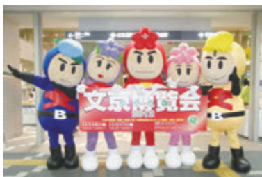
BUNレンジャー今年も出動予定!

11月22日(金) 午前10時～午後6時 11月23日(土) 午前10時～午後5時