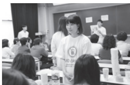
東京大学五月祭にて アルコール遺伝子検査に協力