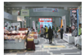
賑わいゾーン(物産展)