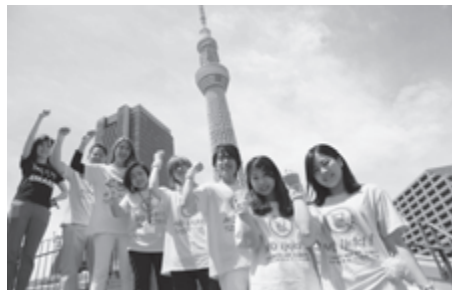
NO IKKI! キャンペーン

最近では、若者の飲酒事故がますます深刻化している事態を前に、志を同じくする大学生の方々とご一緒に活動することも増えてまいりました。今年の東京大学五月祭では、「遺伝子を研究している自分たちとしてできることはないか」と約500人の来場者を対象に、アルコール遺伝子検査を無料で実施する企画を立ち上げた東京大学農学部の有志学生24名の取り組みに賛同し、検査に必要な機器のレンタルなどのコストを全額負担させていただきました。今後も、文京区を拠点に、活動に賛同くださる大学生の皆さんのご協力を賜りながら、多角的に活動を広げ、適正飲酒の普及と飲酒事故の撲滅に努めたいと思います。