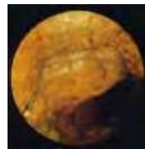
▼ 屋内排水管の 閉塞状況