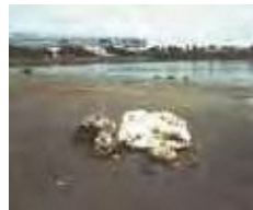
◀ 漂着した オイルボール

油を下水道に流すと下水道管で冷えて固まり、つまりや悪臭の原因になります。また、大雨が降ったとき、固まった油は、はがれてオイルボールとなり、川や海に流出し、水環境を汚してしまうことがあります。