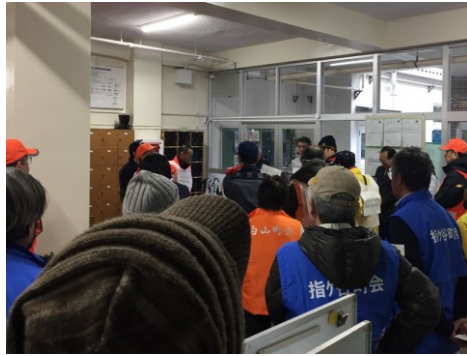
キットを使った初動対応