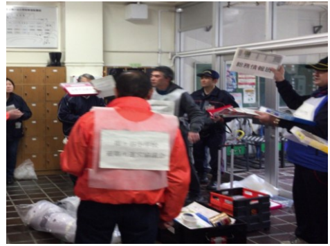
キットを使い、指示を出す