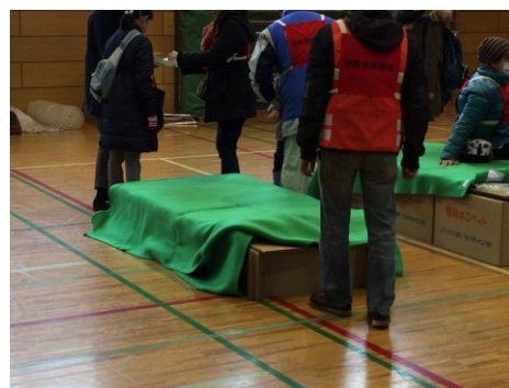
ダンボールベッド組み立て