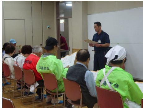
区から福祉避難所の説明