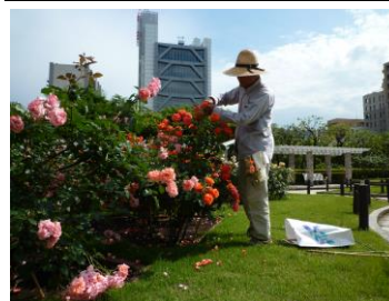
夏季剪定のようす