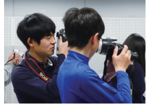
プロ直伝のワンポイントアドバイス