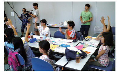
編集会議ではトップページをめくり、チームごとにアピール！

こども新聞では、様々なところに取材に行きます。最近では、肥後細川庭園の「秋の紅葉ライトアップ」ひごあかり」を取材し大河ドラマ「いだてん」の主人公金栗四三について学び記事を書きました。他にも視覚障害者柔道の大会を取材し、直接選手の方からお話を伺う機会や実際にパラリンピック競技を体験する機会もありました。