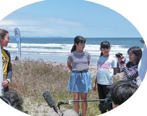
新競技サーフィン取材で遠征（えんせい）