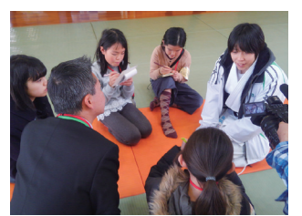
選手への囲み取材を実施（じっし）

こども新聞では、様々なところに取材に行きます。最近では、肥後細川庭園の「秋の紅葉ライトアップ」ひごあかり」を取材し大河ドラマ「いだてん」の主人公金栗四三について学び記事を書きました。他にも視覚障害者柔道の大会を取材し、直接選手の方からお話を伺う機会や実際にパラリンピック競技を体験する機会もありました。