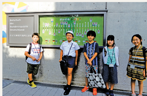
ドイツ大使館の入り口で(サッカードイツ代表チームの紹介パネル)