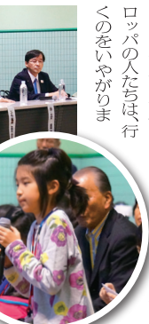
1966年に日本は国際連盟(国連)から認められました。1993

1936年に、1940年のオリンピック会場をどこにするかきめました。そのときに東京がごうほに出て、オリンピック会場が東京に決定しました。しかしヨーロッパの人は東京にくるのに18日かかったそうです。ヨーロッパの人は「行くのをいやがりま