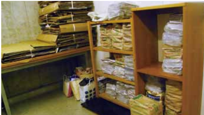
↑マンションでは保管庫に資源置場を設置しています。

区では、団体が回収した資源の重量1kgにつき、6円の報奨金をお支払いしています。