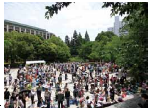
教育の森公園でのフリーマーケットの様子→

7月26日(土)は親子出店のフリーマーケット、 10月25日(土)は文京エコ・リサイクルフェアとの 同時開催だよ! マイバッグを持って行ってみよう!