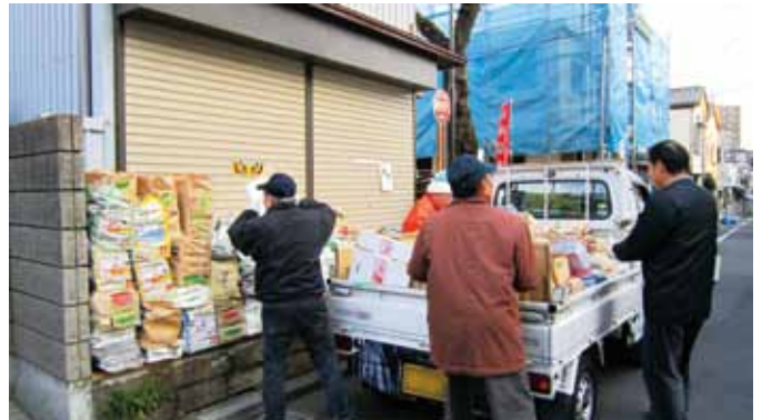
↑みんなで協力して集めています。

集める資源の品目や収集の頻度、収集場所などは、団体と回収業者で相談して決めていただきます。始めてみようと思われた方は、お気軽にリサイクル清掃課（TEL：5803-1184）までご相談ください。