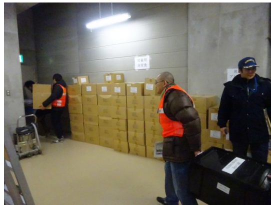
(備蓄倉庫から必要な物資を運搬する)