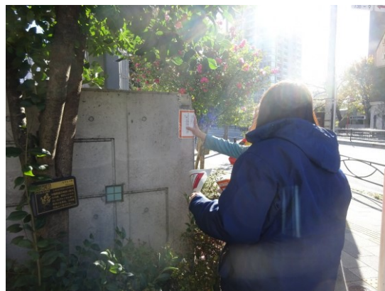
(誘導表示などの掲示)