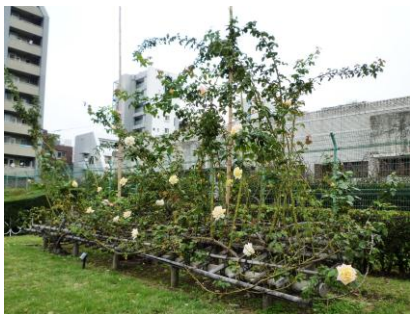
ベッド仕立て 「ピース」