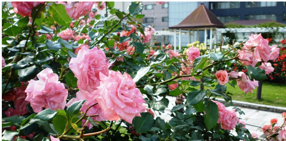
本郷給水所公苑 （文京区本郷2-7）平成22年5月撮影 5月と10月を1番の見ごろとして、色とりどりのバラを咲かせます。