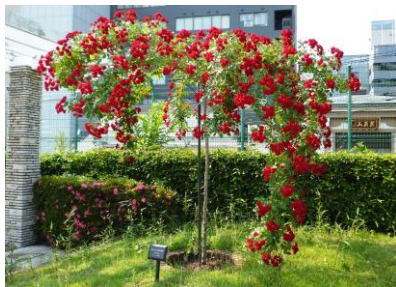
ウィーピング仕立て 「スカーレット メイディランド」