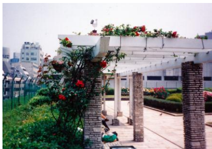
パーゴラ仕立て 「クリムソン グローリー」