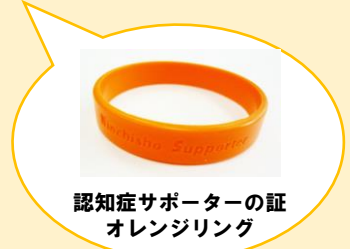
認知症サポーターの証 オレンジリング