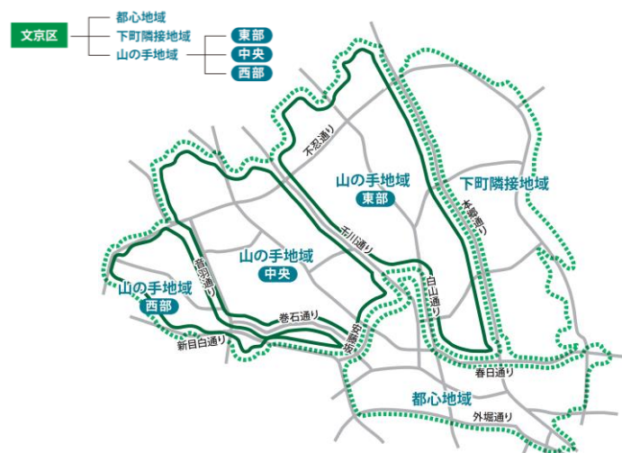
図 15 文京区都市マスタープランに示す5地区

また、地域特性を踏まえた構想とすること、重点整備地区の要件としておおよそ400ha未滿とされている（移動等円滑化の促進に関する基本方針）ことから、文京区都市マスタープランに示す5地区（都心地域、下町隣接地域、山の手地域東部、山の手地域中央、山の手地域西部）それぞれをバリアフリー法に基づく重点整備地区として設定します。