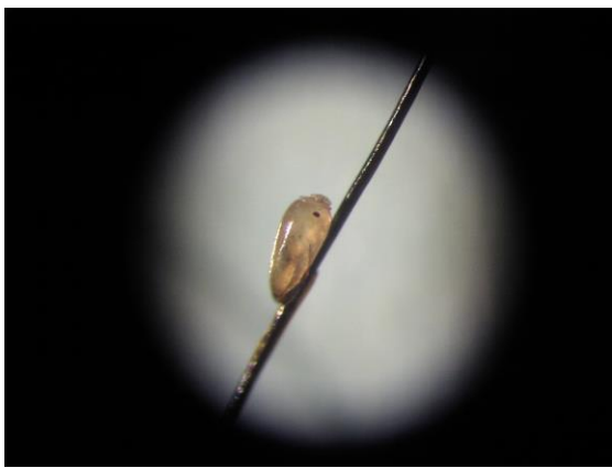
アタマジラミ卵 約 0.5 mm