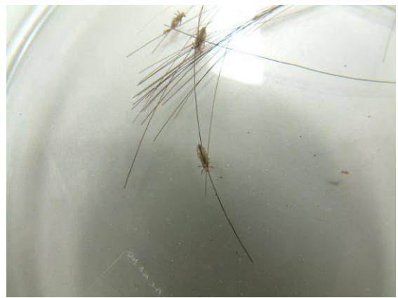
アタマジラミ成虫 約 2~3 mm

不衛生で問題となるシラミは、コロモジラミです。下着などの衣服に寄生し、感染症の原因ともなります。衛生状態が良好な現代社会では、通常的生活では問題ありません。