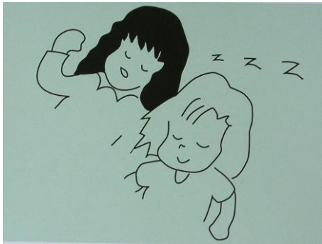
(図1)髪と髪が重なる