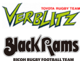
ジャパンラグビートップリーグチーム トヨタ自動車ヴェルブリッツ リコーブラックラムズ