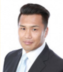
元ラグビー日本代表/ スポーツコメンテーター 大西将太郎