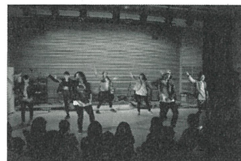
▲ 昨年度の春フェスの様子