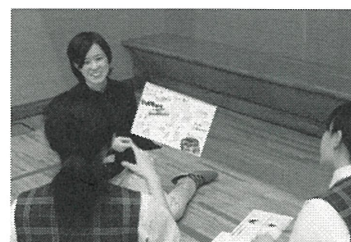
▲ 出張 b-lab の様子