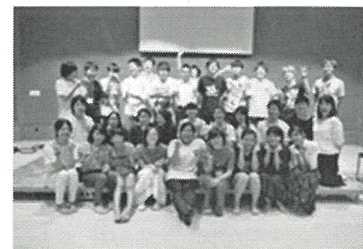
▲ 9期中高生スタッフ