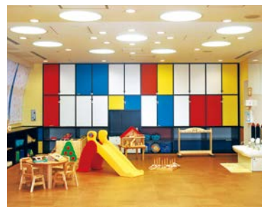
3階 キッズルームシビック

親子が楽しく遊びながら、他の親子との交流や情報交換が図れる場。区内在住の3歳未満の子どもと保護者の方が対象。