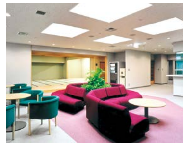
4階 シルバーセンター

高齢者の方々の生きがいと健康づくりの場。シルバーホール、和室、会議室及びラウンジ。