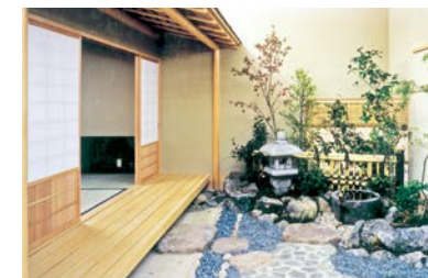
地下1階 アカデミー文京

生涯学習推進の拠点。学習室、茶室・和室(地下1階)、展示室(1階)、音楽室(地下1階・地下2階)など。