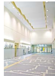
地下2階エントランス