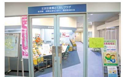
地下2階 産業とくらしプラザ

生涯学習推進の拠点。学習室、茶室・和室(地下1階)、展示室(1階)、音楽室(地下1階・地下2階)など。