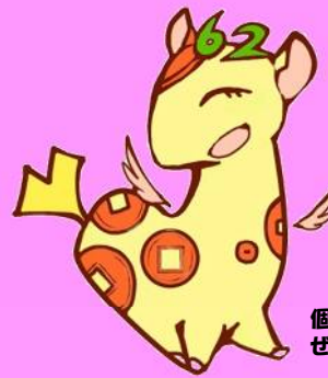
個人住民税PRキャラクター ぜいきりん

東京都と都内区市町村はオール東京で、平成29年度から原則として全ての事業主の方に、特別徴収義務者の指定を実施しますので、事業主の方は、ご理解・ご協力をお願いいたします。