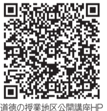
道徳の授業地区公開講座HP