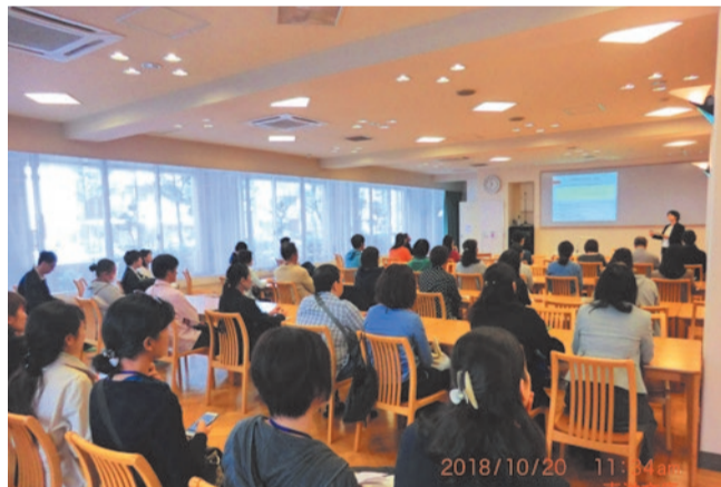
教科の授業地区公開講座の様子

「教科・道徳の授業地区公開講座」は、学習指導の方法・内容の充実への取組として教科や道徳の授業を保護者や地域に対して公開しております。そこでは、学習についての意見交流、講師による指導助言の機会を設けることによって、小・中学校における教育活動の充実と開かれた学校づくりの実現を目指します。また、意見交換を通して、学校・家庭・地域社会が一体となり道徳教育を推進しています。日程は、区教育委員会のホームページに掲載していますので、お越しく下さい。