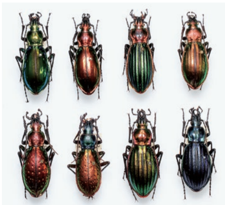
昆虫の形と色の不思議