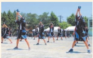
お揃いの法被を着て踊るソーラン節

現在、全校生徒63名と区内で最も小規模の学校です。その分、生徒一人ひとりが主体的に活動できる場があり、学校生活を通して豊富な経験をすることが出来ます。また、先輩・後輩のつながりが強く、運動会では、各種目を全学年で実施します。特に、全校生徒で踊るソーラン節は圧巻です。