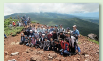
八ヶ岳移動教室での登山

移動教室および林間学校では、八ヶ岳高原学園の広大な自然の中で普段できない体験を通じて、豊かな人間関係を育てています。