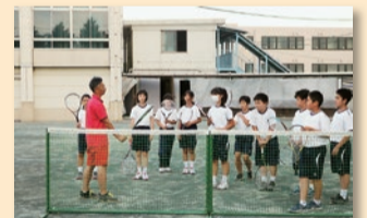
部活動(ソフトテニス部)の様子

スポーツや文化および科学に親しませ、興味・関心や意欲を高めるとともに、責任感、連帯感を養うため、教育活動の一環として展開しています。さらに、令和元年度より施行の「文京区部活動ガイドライン」に基づいた部活動指導員を導入することで、生徒の技術向上、健全育成などに役立てています。