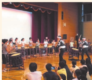
鼓童体験学習の様子

体力測定の実態改善策として、元プロ野球選手による投げ方教室を実施しています。スポーツだけでなく伝統文化や日本の良さを知ること、外国の文化を紹介して下さる方とのふれあいで国際理解に繋げることもオリ・パラ教育としてとらえています。