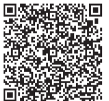
教科の授業地区公開講座HP