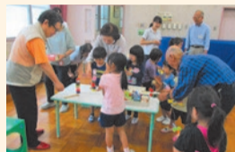
祖父母や後楽クラブの方と一緒に遊びを楽しむ園児

近隣の保育園や小・中学校との交流はもちろんのこと、隣接している都立文京盲学校や町会、高齢者クラブの方々との交流が盛んに行われています。さまざまな方々とのふれあいの中で、人と関わる楽しさを感じる機会になっています。