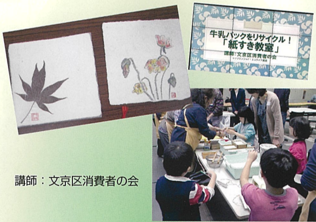
講師:文京区消費者の会