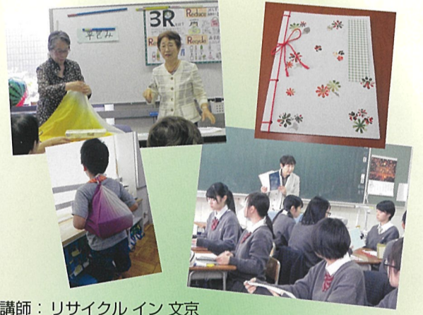
講師:リサイクル イン 文京