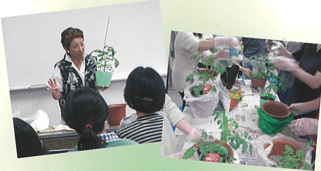
講師:NPO法人 緑のごみ銀行