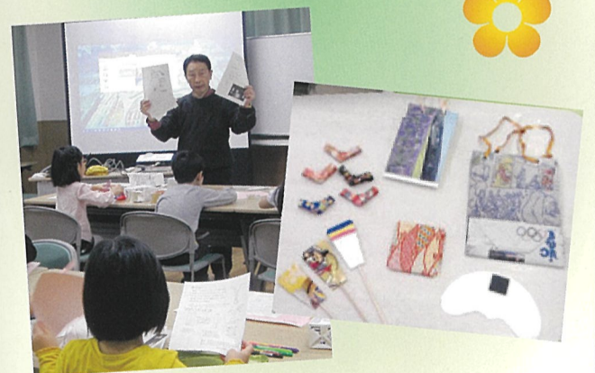
講師:NPO法人 エコ・シビルエンジニアリング研究会 -市民環境村塾