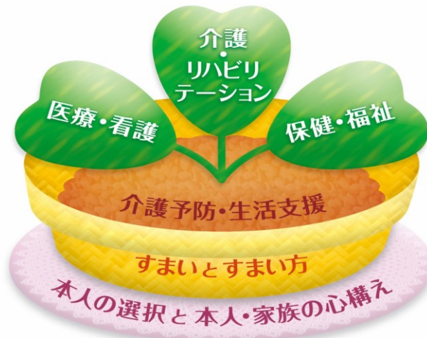
地域包括ケアの植木鉢イラスト

出典：三菱UFJリサーチ&コンサルティング「<地域包括ケア研究会>地域包括ケアシステムと地域マネジメント」