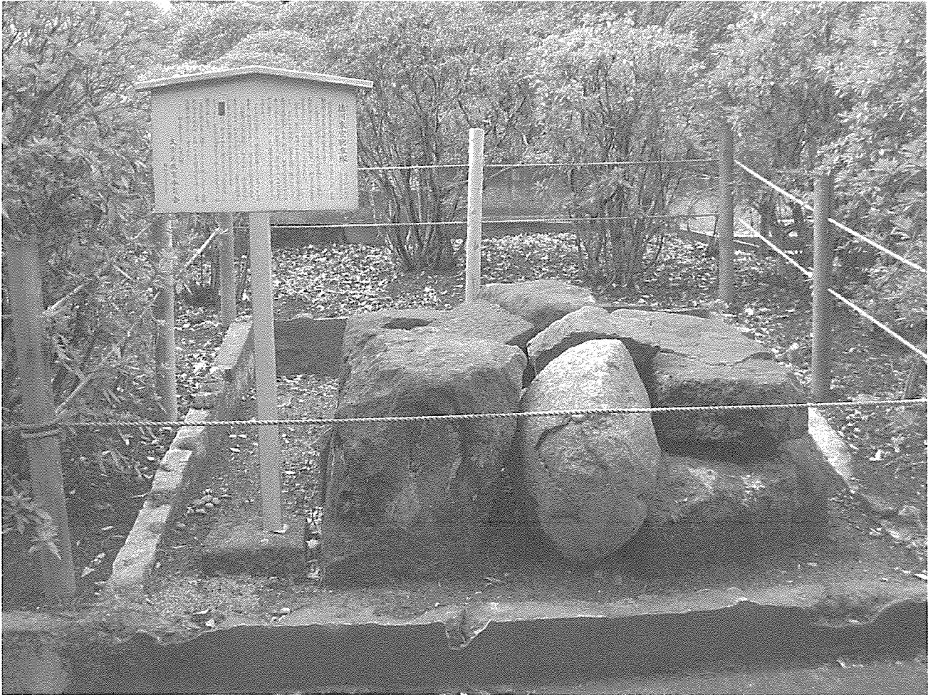
文京区指定文化財「徳川家宣胞衣塚」現状