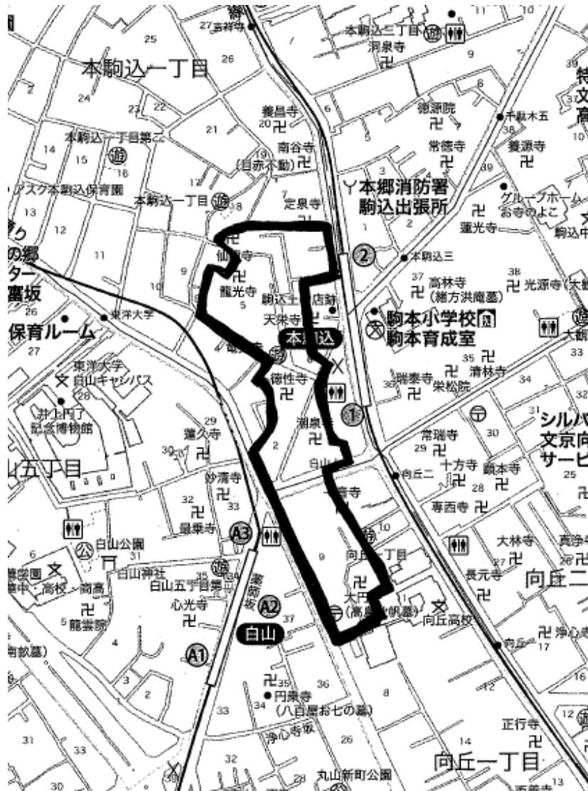
白山上自治会地区の範囲（防犯対策を推進する地区）