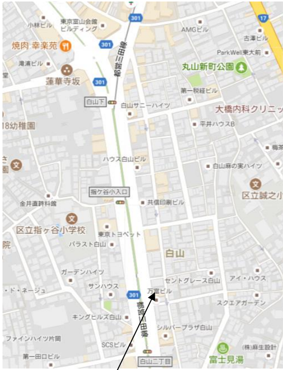
(仮称) サンライズキッズ保育園白山園