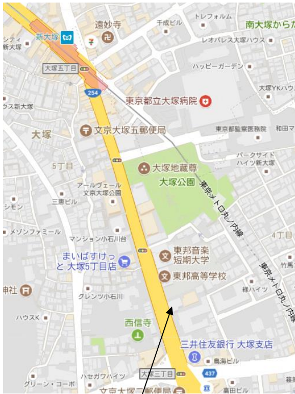
(仮称) キューピールーム新大塚園