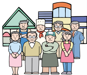
区内で事業を行なう方