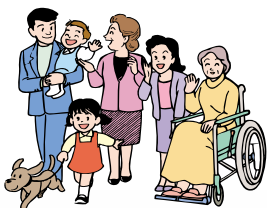
文京区に住む人・働く人・学ぶ人

個人情報の保護に配慮しつつ、それぞれが保有する地域の課題に関する情報を共有化します