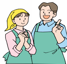
NPO法人やボランティア団体など