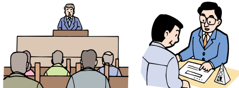
区議会と執行機関

区民、地域活動団体、非営利活動団体、事業者、区が対等の関係で協力し、社会資源を有効に活用しながら、地域社会の課題の解決を図る社会のあり方をいいます