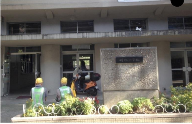
入り口周りの構えと運動場への抜け