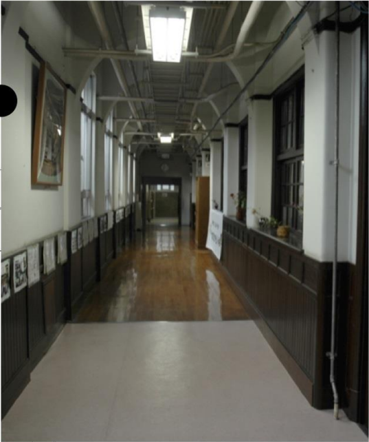
民家... 廊下のアーチ