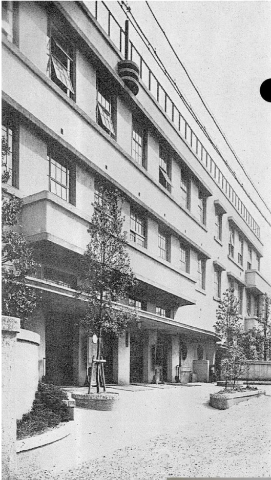
見所のファサード