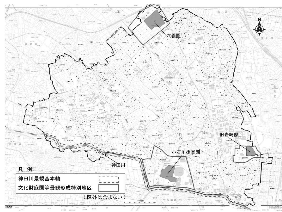
図3-2 神田川景観基本軸及び文化財庭園等景観形成特別地区の位置図