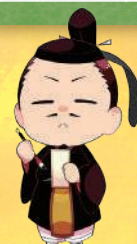
かるたの街文京 宣伝大使「みちぎね公」