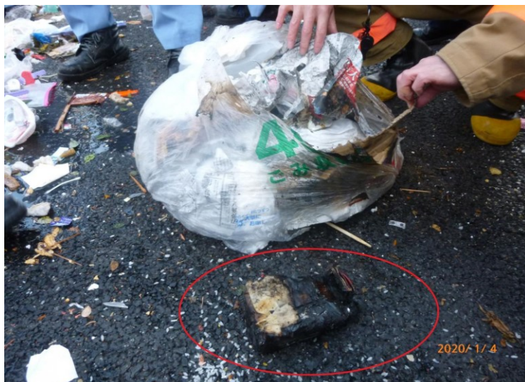
(赤い囲みが可燃ごみの中に出されていた「小型充電式電池」)

小型充電式電池(リチウムイオン電池などの二次電池)が集積所に出され、発火する事故が発生しています。 小型充電式電池は、誤った取り扱いで火災等が発生し、大変危険です。 正しい方法で廃棄をしていただきますよう、ご理解とご協力をお願いいたします。