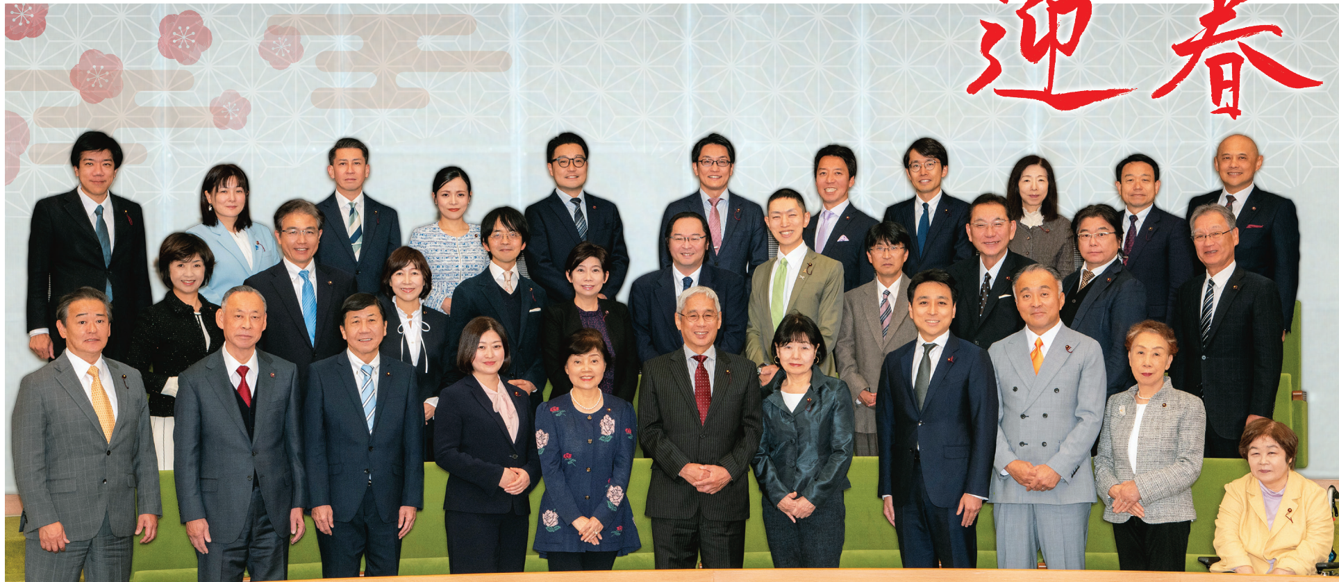
文京区議会議場にて撮影