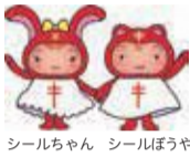
シールちゃん シールぼうや

日本では1日あたり35人の結核患者が発生し、5人が命を落としています。昨年、文京区では34人が新たに結核と診断されました。2週間以上続く咳や痰などの症状、長引くだるさ、急な体重減少がある場合、結核を疑って早めに医療機関を受診しましょう。